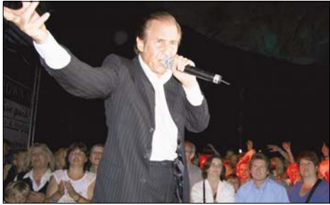
Schlagerikone Michael Holm stimmte während der ersten NRW-Schlagerparade seine Klassiker an: „Tränen lügen nicht“, „Mendocino“ oder „Barfuß im Regen“.