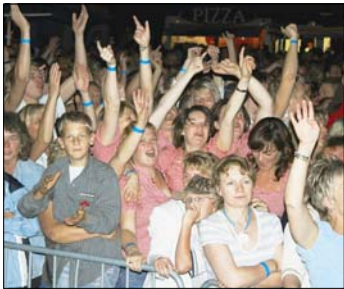
Auch die viel besungenen Anitas feierten ausgelassen in ihren rot-weiß-karierten Blusen auf dem Heimathof und jubelten Jürgen Drews zu.