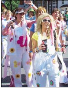
„Hossa“: Diese Fußgruppe sorgte während des Umzugs für Stimmung.