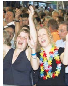
Gut 4000 Gäste sangen auf dem Heimathof textsicher mit, als die deutschen Schlager erklangen.