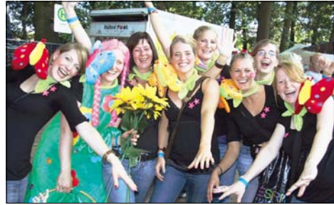
Pinke Priel-Blümchen auf dem Shirt und gelbe Sonnenblumen in der Hand – der deutsche Schlager bot reichlich Stoff, um sich stilecht einzukleiden.